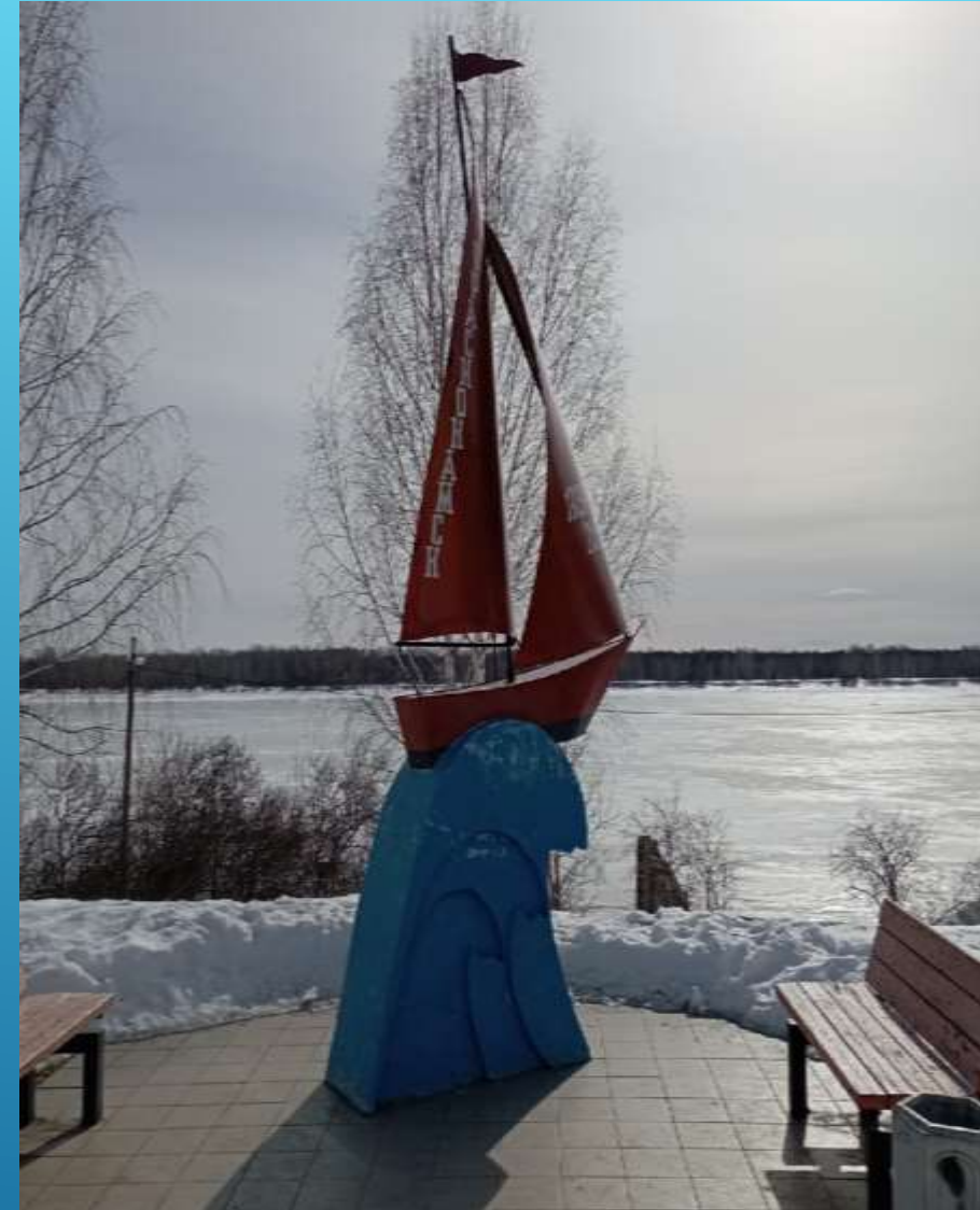
Кораблик с надписью на парусе «Краснокамск» установлен в 2013г.