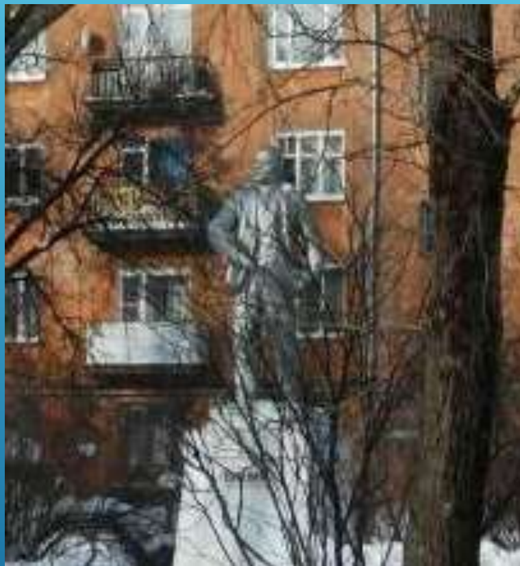
Установлен в 1961г. в скверике на ул. Чапаева