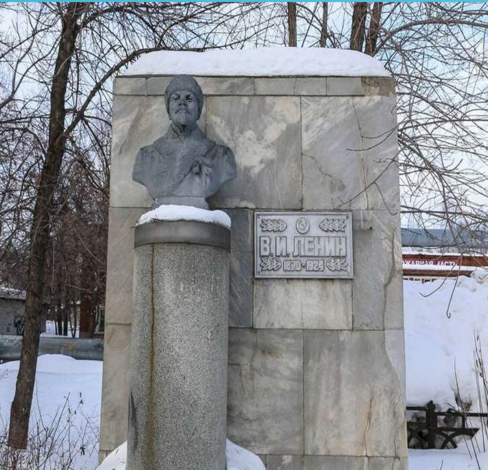
Бюст установлен в 1970г. напротив Камского ЦБК