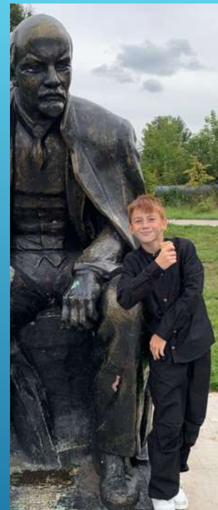
Установлен в 2020г. на эспланаде