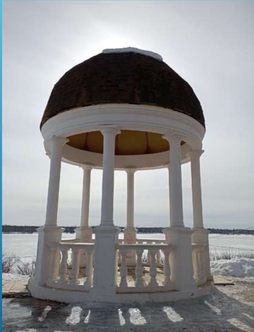
Ротонда – символ влюбленных и молодых. Установлена в 2008г.