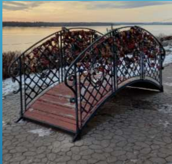
Мостик влюблённых установлен в 2010г.